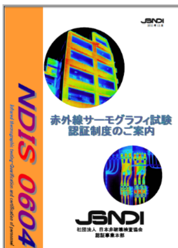
赤外線サーモグラフィ試験認証制度のご案内 (社)日本非破壊検査協会ホームページに掲載)

(*) 日本非破壊検査協会の規格(NDIS 0604:赤外線サーモグラフィ試験 - 技術者の資格および認証 - )における資格試験の受験要件として、規定時間(TTレベル1では40時間)の事前訓練が義務付けられています。