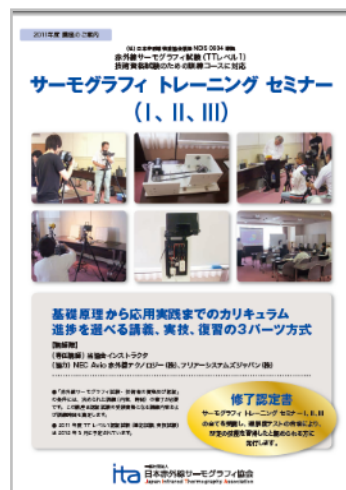
サーモグラフィトレーニングセミナーパンフレット (社)日本赤外線サーモグラフィ協会ホームページに掲載)